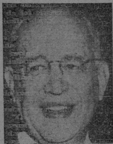
Fernando Lobo, de Brasil, nuevo presidente del Consejo de la Organización de Estados Americanos, con residencia en Washington