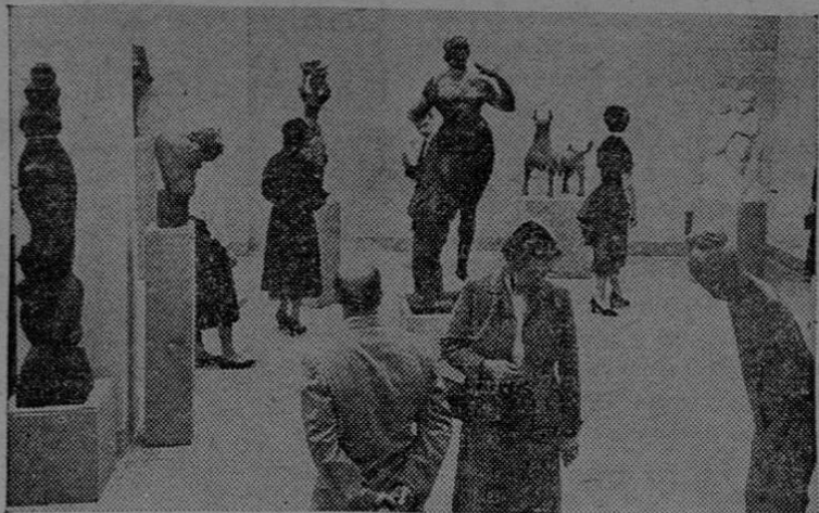
Sala de esculturas del Museo Whitney de Arte Norteamericano, de Nueva York, institución patrocinadora de los artistas de Estados Unidos.