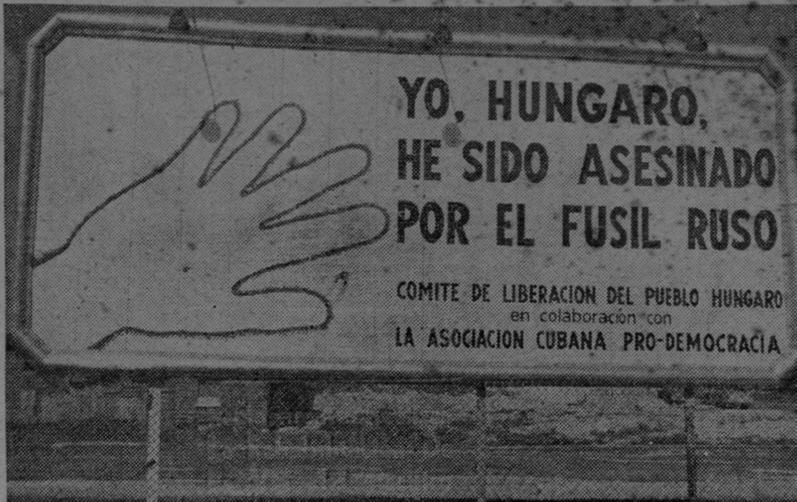
En momentos en que los patriotas húngaros luchaban por su libertad en las calles de Budapest, en La Habana, Cuba, aparecieron en los lugares más céntricos de la ciudad y a lo largo de las carreteras, carteles, como el que aparece en esta fotografía. Fueron colocados por el Comité de Liberación del Pueblo Húngaro y la Asociación Cubana Pro-Democracia, institución que lucha contra las actividades antidemocráticas