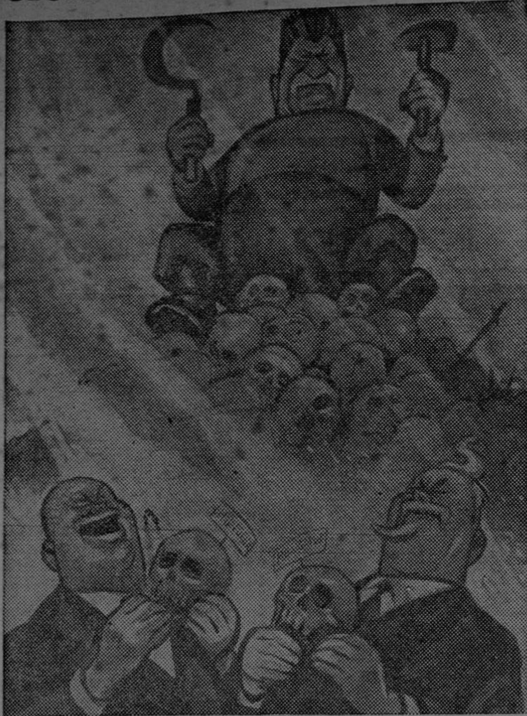
Esta es la manera de elevar el pedestal del maestro De la revista "HOY", por Cabral